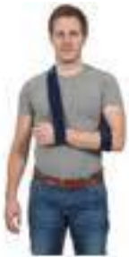
Afbeelding 3 dragen van de sling