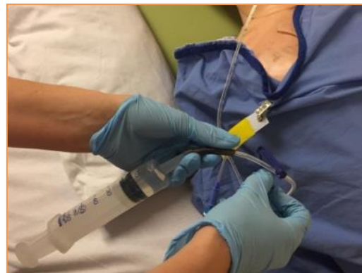
Stap 8: Maak het klemmetje los van de sonde