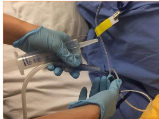
Stap 6: Koppel de slang los van de sonde