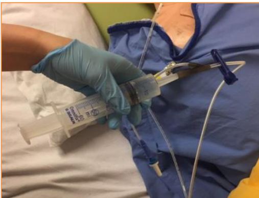
Stap 7: Plaats de spuit met NaCl 0.9% op de sonde