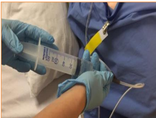
Stap 9: Spuit rustig de NaCl 0.9% in de sonde